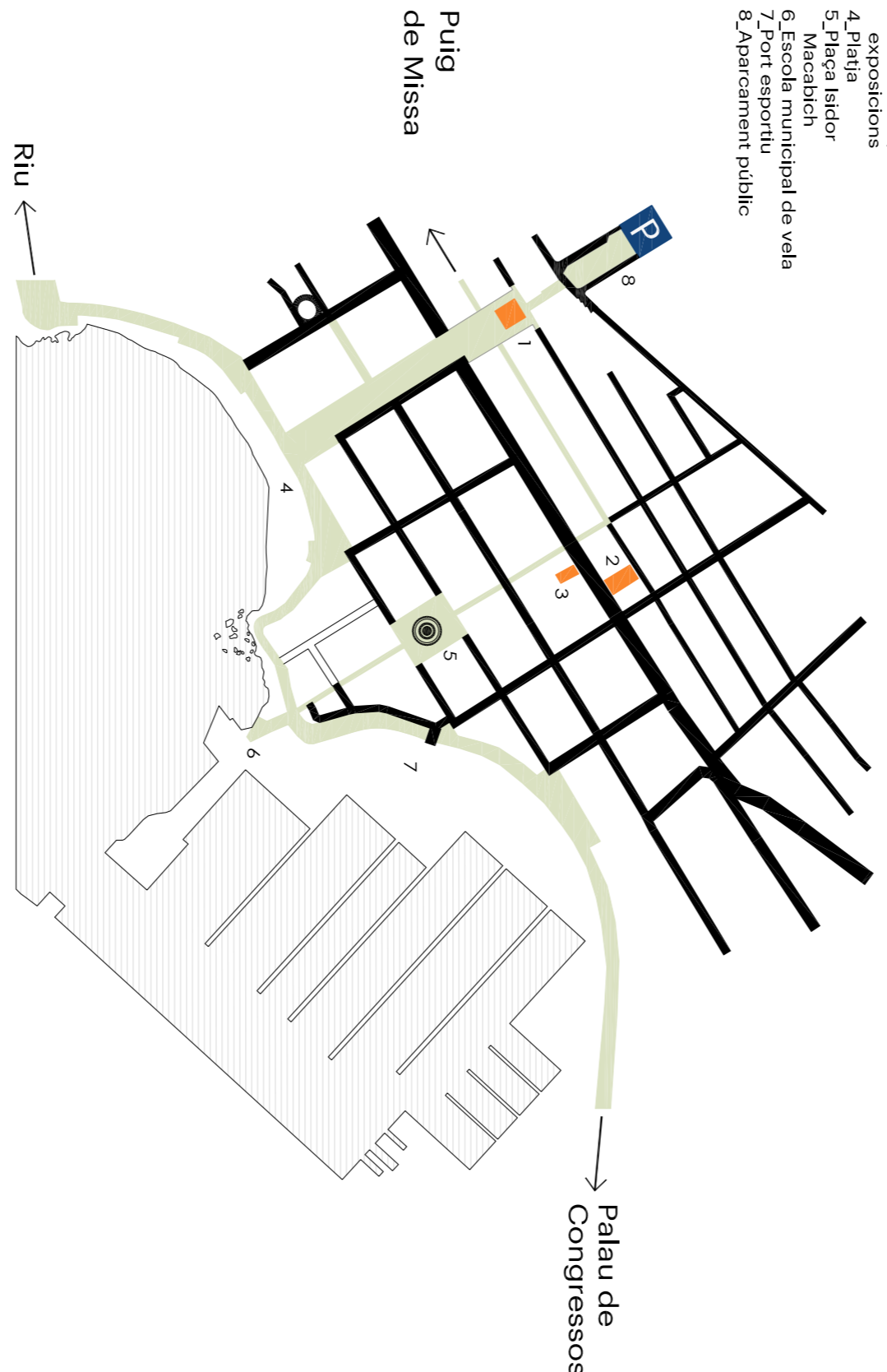
PUNTOS DE INTERÉS