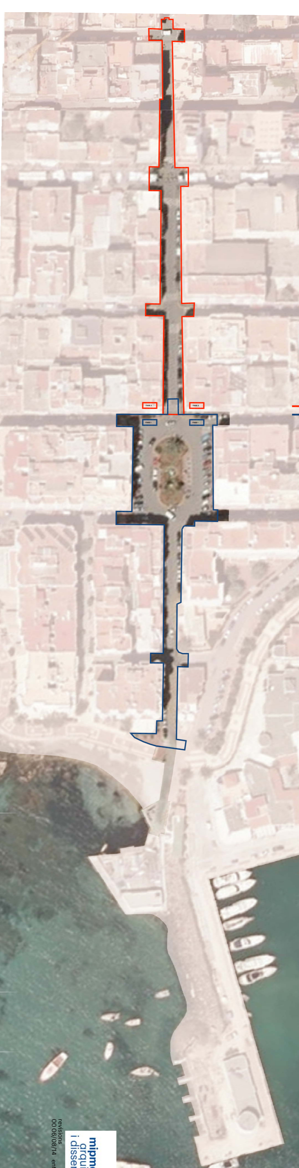
ESTADO ACTUAL. ORTOFOTO